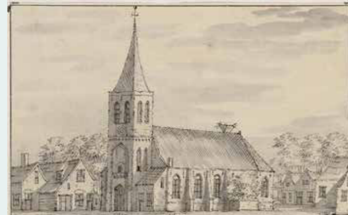
De kerk vanuit het zuidwesten met aan weerszijden huizen. Op het dak van de kerk een ooievaarsnest.

Aan de Kerklaan in Oudorp staat op een verhoging, of een terp, het prachtige witgeschilderde kerkje met de toepasselijke naam De Terp. De kerk is al eeuwen een beeldbepalende verschijning in het dorp. Maar door de eeuwen heen is de kerk van gedaante veranderd. In de middeleeuwen stond er een veel grotere kerk met een grote hoge toren. En de resten van die toren, hebben onze archeologen teruggevonden. Net als het koor van de vroegere kerk. Niet door te graven, maar door te meten boven de grond.