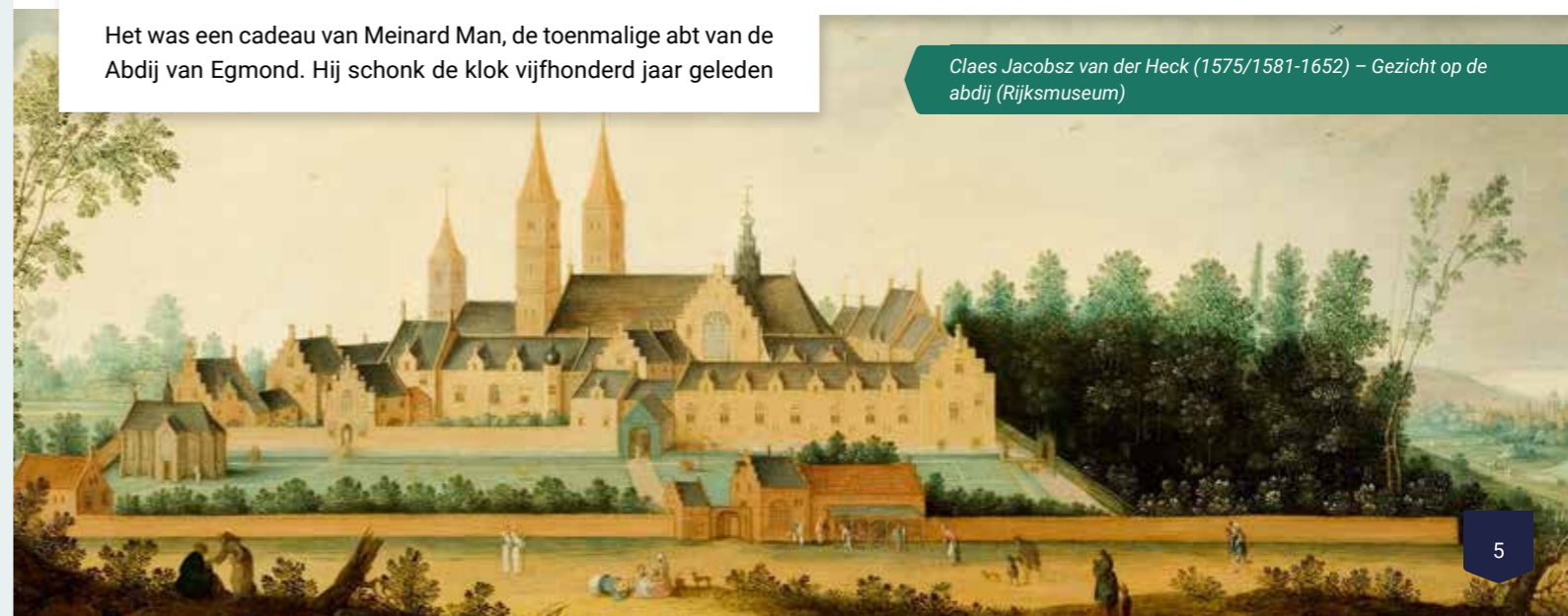
Claes Jacobsz van der Heck (1575/1581-1652) – Gezicht op de abdij (Rijksmuseum)