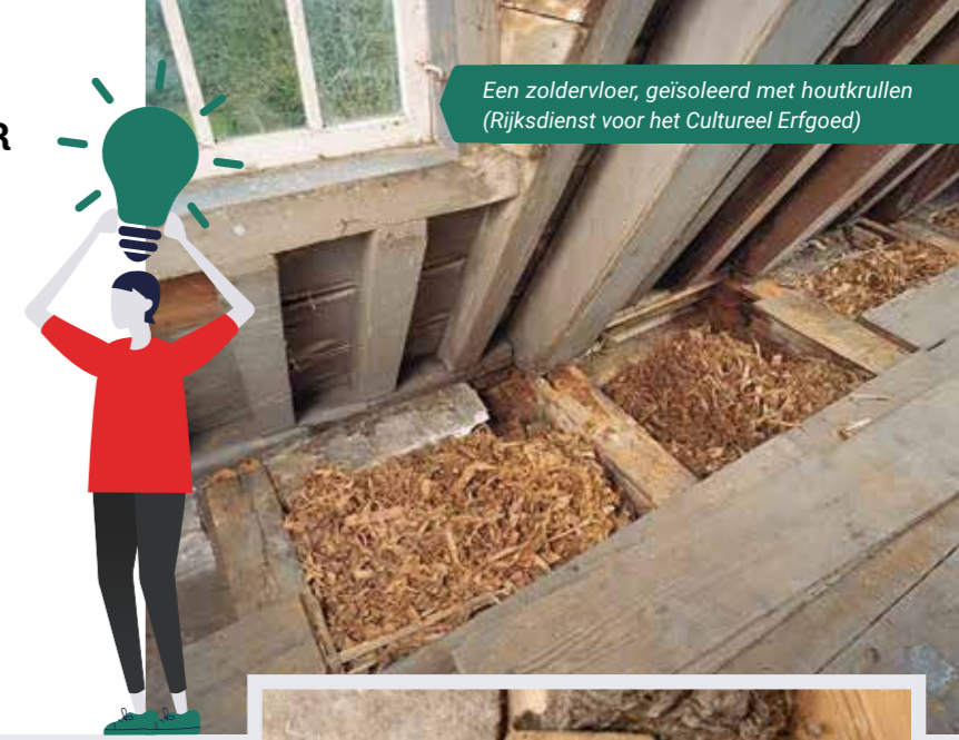
Een zoldervloer, geïsoleerd met houtkrullen

Isoleren is van alle tijden. In de loop van de eeuwen waren er allerlei verschillende manieren van isoleren. Afhankelijk van de periode, de beschikbare materialen en de bouwtechnieken. Het gebruik van natuurlijke materialen was toen vanzelfsprekend, want er was niet anders. Nu is het isoleren met natuurlijk (of biobased) materiaal weer helemaal terug. En zeker voor monumenten is dat een goed idee!