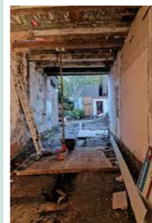
Doorkijkje door het huis naar de tuin