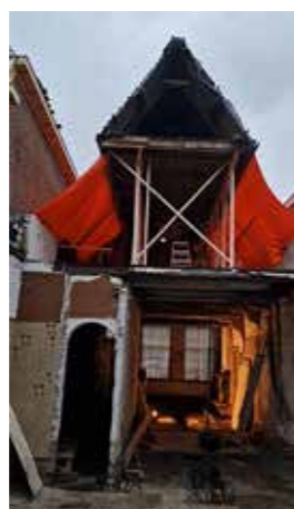
Foto boven: Het huis vanaf de achterkant met de zeventiende-eeuwse verdiepingsvloer