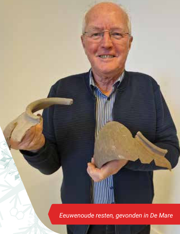
Eeuwenoude resten, gevonden in De Mare