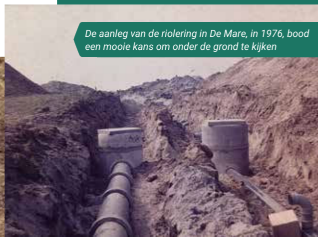
De aanleg van de riolering in De Mare, in 1976, bood een mooie kans om onder de grond te kijken

De nieuwe archeologische verwachtingskaart die de gemeenteraad 28 november heeft vastgesteld, wordt opgenomen in het omgevingsplan. Op die manier kunnen we straks voorwaarden verbinden aan een omgevingsvergunning. Dat er bijvoorbeeld gelegenheid moet zijn voor archeologisch onderzoek. Zo kunnen we ook in de toekomst goed blijven zorgen voor ons archeologische erfgoed.