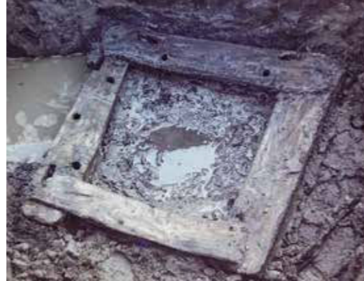
Foto: Fundatie van een waterput, gemaakt van elzenhout uit de achttiende eeuw