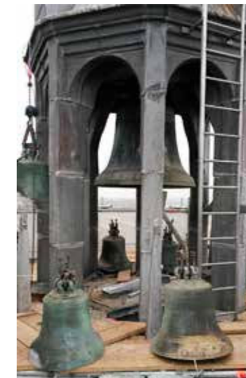
Foto boven: De slagklok in het vieringorentje van de Grote Kerk, tijdens de restauratie in 2014/2015

Het was een cadeau van Meinard Man, de toenmalige abt van de Abdij van Egmond. Hij schonk de klok vijfhonderd jaar geleden