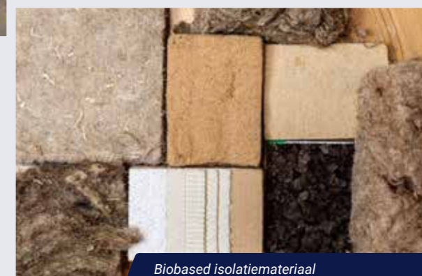
Biobased isolatiemateriaal (Blue City - foto: Jacqueline Fuijkschot)