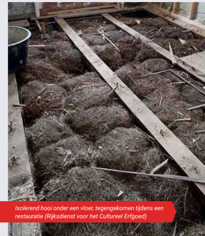
Isolerend hooi onder een vloer, tegengekomen tijdens een restauratie (Rijksdienst voor het Cultureel Erfgoed)

Tot en met de negentiende eeuw was isoleren niet, zoals nu, de dagelijkse praktijk. Gebouwen werden alleen geïsoleerd tegen de kou. Wel probeerden ze ook op andere manieren het wooncomfort te verhogen. Met eenvoudige middelen zoals gordijnen, tapijten, luiken en blinden kon je het klimaat binnen een stuk aangenamer maken.