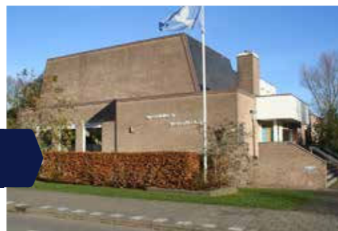
Foto links: Het kerkgebouw van het Apostolisch Genootschap: een rechthoek met een trapezium erop. Foto rechts: Het interieur van de kerk

"Net als veel anderen waarschijnlijk, denk ik bij kerk het eerst aan zoiets als de Grote Kerk van Alkmaar. Dit is een heel ander gebouw maar het is dus ook een kerk. Gebouwd in 1980. Als je kijkt naar de vorm, zie je een rechthoek met daarop een trapezium, een rechthoek met twee schuine zijden. Naar mijn idee een kerk waarbij vooral de functie voorop stond bij het ontwerpen. Het gebouw is ontworpen voor een optimaal gebruik en daarna is pas gekeken hoe dat constructief mogelijk gemaakt kon worden. Daardoor is de constructie ondergeschikt aan het gebruik."