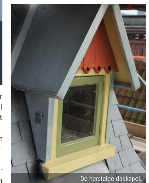
De herstelde dakkapel.