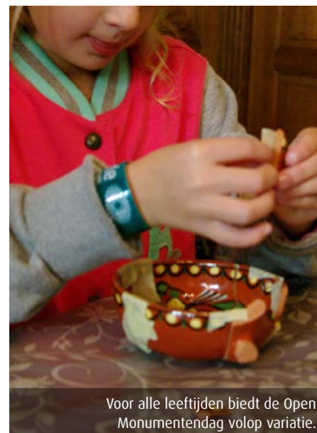
Voor alle leeftijden biedt de Open Monumentendag volop variatie.

Iconen zijn opvallend in het straatbeeld en vertellen over de ontstaansgeschiedenis van hun omgeving. Vaak zijn de gebouwen die we in onze omgeving als iconen zien ook nog eens van binnen en buiten gedecoreerd met