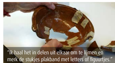
"Ik haal het in delen uit elkaar om te lijmen en merk de stukjes plakband met letters of figuurtjes."