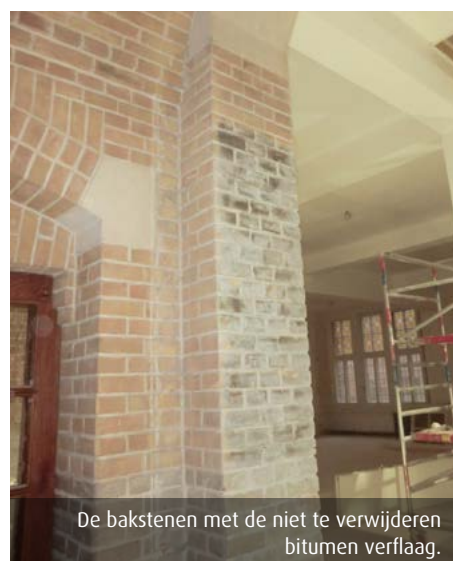
De bakstenen met de niet te verwijderen bitumen verflaag.

In aanvang was de kantoorzaal door drie bogen met klantenbalies afgescheiden van de publieke entreezone. Deze bogen zijn heropend en in één ervan is de oude ‘effectenbalie’ gereconstrueerd op basis van de oorspronkelijke bouwtekeningen. De originele smeedijzeren hekjes lagen nog op zolder. De bakstenen in de bogen bleken bedekt