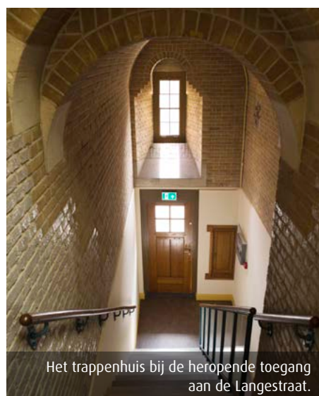
Het trappenhuis bij de heropende toegang aan de Langestraat.

met een hardnekkige bitumenachtige verf (uit circa 1980). Omdat de verf niet verwijderd kon worden zonder de stenen kapot te maken, is besloten deze laag vlak te schuren en de bakstenen er opnieuw op te schilderen: een geslaagde vorm van camouflage-techniek. De wanden en plafonds die in de loop van de tijd allemaal wit waren geschilderd, kregen bij de restauratie de oorspronkelijke kleuren terug: mosgroen, okergeel en crème-wit én eiken. De vloeren zijn, net als in de bouwtijd, weer afgewerkt met marmoleum in mosgroen en roodbruin en de historische lampen en de Kropholler-meubels zijn zo veel mogelijk teruggeplaatst. Dit alles met een verrassend resultaat. In de nieuwe situatie zal het gebouw meer ‘meedoen’ in de stad. De bel-etage heeft een functie gekregen als winkelgalerie met ondergeschikte horeca, de bovenverdiepingen blijven kantoor en de dienstwoning wordt weer bewoond.