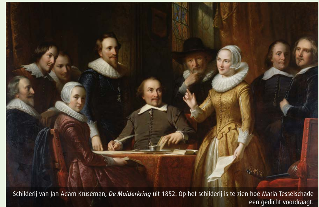
Schilderij van Jan Adam Kruseman, De Muiderkring uit 1852. Op het schilderij is te zien hoe Maria Tesselschade een gedicht voordraagt.

begaafde regenten en geleerden uit de tijd van Hooft, met elementen van Noord- en Zuid-Nederland, protestant en katholiek. Een kring die kon dienen als een soort model voor het nieuwe Nederland. Ook Maria Tesselschade maakte deel uit van deze 'kring'. Dat er in haar tijd veel ontmoetingen zijn geweest tussen deze mensen, is zeker. Hooft nodigde regelmatig vrienden, familie en kennissen uit in zijn Muiderslot. En vaak waren daarbij verschillende in die tijd beroemde personen aanwezig.