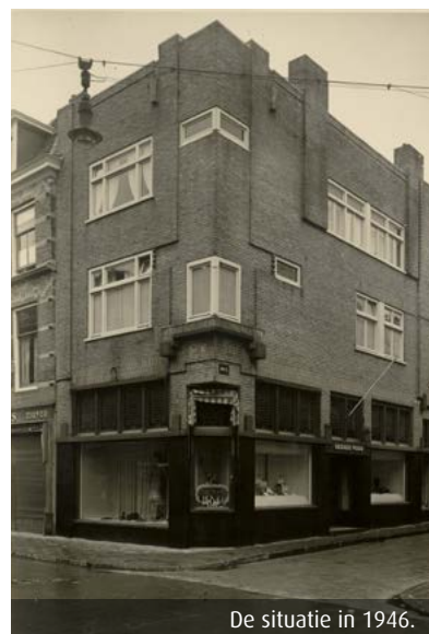
De situatie in 1946.