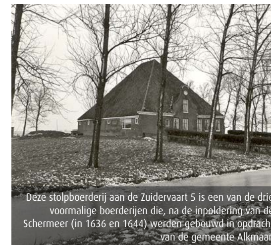
Deze stolpboerderij aan de Zuidervaart 5 is een van de drie voormalige boerderijen die, na de inpoldering van de Schermeer (in 1636 en 1644) werden gebouwd in opdracht van de gemeente Alkmaar.