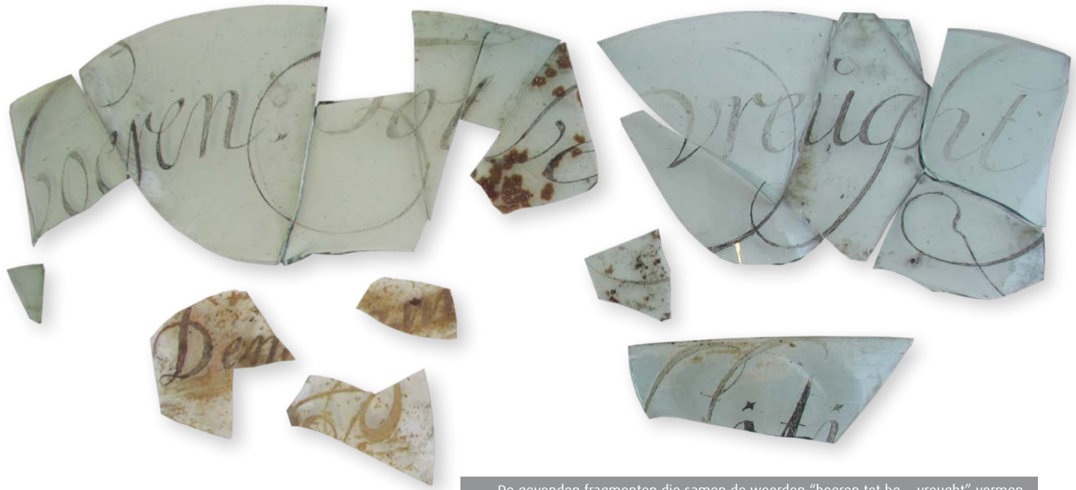
De gevonden fragmenten die samen de woorden "boeren tot be... vreught" vormen.

In de beerput werd al snel een scherp gegraveerd glas gevonden. Dat werd vergeleken met een bekend exemplaar van Maria Tesselschade in het Rijkmuseum en de gelijkenis was treffend. Dit in combinatie met de wetenschap dat zij op deze plek gewoond heeft, maakt dat met zekerheid gezegd kon worden dat Maria Tesselschade de glasscherf had gegraveerd. Een hele bijzondere ontdekking die de landelijke pers haalde.