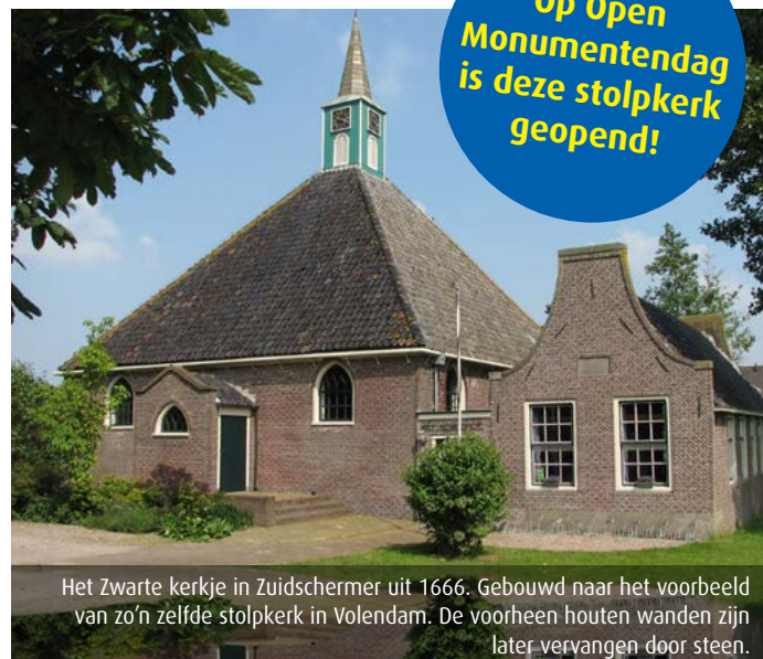
Het Zwarte kerkje in Zuidschermmer uit 1666. Gebouwd naar het voorbeeld van zo'n zelfde stolpkerk in Volendam. De voorheen houten wanden zijn later vervangen door steen.

Zoals stagiaire Renée Stroomer schreef in nieuwsbrief 43: De emotionele waarde die we toekennen aan ons erfgoed gaat ook en misschien wel vooral om de verhalen die erbij horen. In Schermer en Graft-De Rijp ligt een prachtig en cultuurhistorisch waardevol landelijk gebied, waar de stolpen een belangrijk deel van zijn.