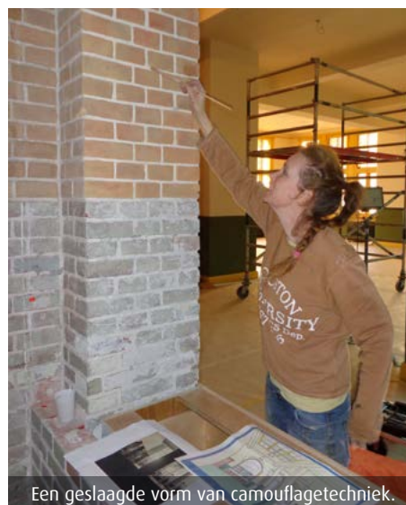
Een geslaagde vorm van camouflage-techniek.