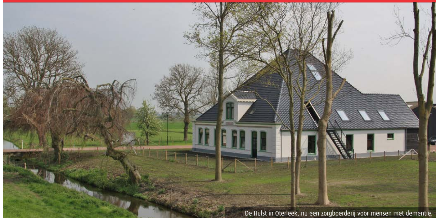
De Hulst in Oterleek, nu een zorgboerderij voor mensen met dementie.

Wat zou Noord-Holland zijn zonder de stolpen? Veel mensen houden van het Noord-Hollandse landschap, ook vanwege de karakteristieke boerderijen. De Boerderijstichting Noord-Holland staat stolpeigenaren en gemeenten bij met advies en redde al veel stolpen van de sloop. De gemeente Alkmaar, de Boerderijstichting en veel eigenaren van stolpen in de gemeente Alkmaar zien in elk geval voldoende redenen om met elkaar dit landschap mét stolpen te blijven koesteren.