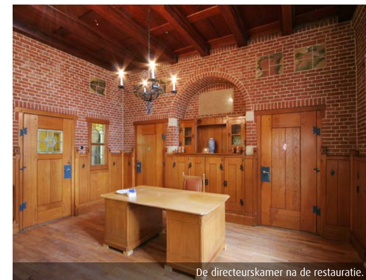
De directeurskamer na de restauratie.