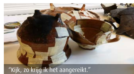
"Kijk, zo krijg ik het aangereikt."