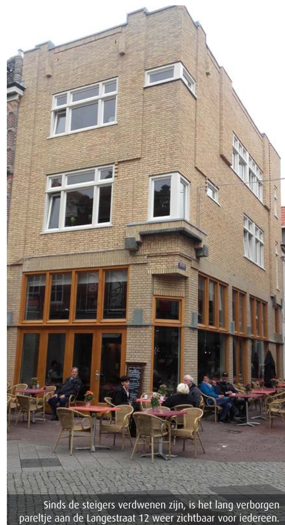
Sinds de steigers verdwenen zijn, is het lang verborgen pareltje aan de Langestraat 12 weer zichtbaar voor iedereen.

directeur Segesta en initiatiefnemer van de restauratie