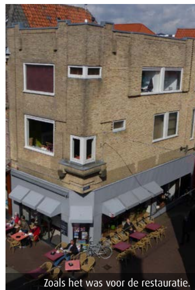
Zoals het was voor de restauratie.

In het begin van de twintigste eeuw werd in Nederland veel gebouwd volgens de zogenaemde Amsterdamse School. Een herkenbare expressieve en kleurrijke bouwstijl. De Alkmaarse binnenstad telt één Amsterdamse Schoolpand en dat staat op de hoek van de Langestraat en de Houtuil. Talloze inwoners van Alkmaar en omgeving en minstens zoveel toeristen, zaten ooit op het terras bij de lunchroom die voorheen bekend stond onder de naam Soecker, maar inmiddels al enkele jaren Lunchroom Prego heet. Vastgoedeigenaar Segesta nam het initiatief om dit monument in oude stijl te restaureren tot een nieuw pareltje aan de Alkmaarse winkelstraat.