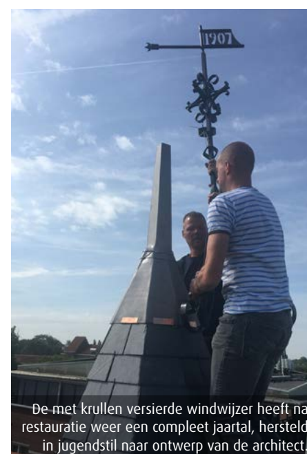
De met krullen versierde windwijzer heeft na restauratie weer een compleet jaartal, hersteld in Jugendstil naar ontwerp van de architect.

Het hoge herenhuis met diverse speelse Jugendstilaccenten wordt goed verzorgd door de huidige bewoners. Zo werd onlangs, na honderd jaar weer en wind, de toren met windwijzer gerestaureerd.