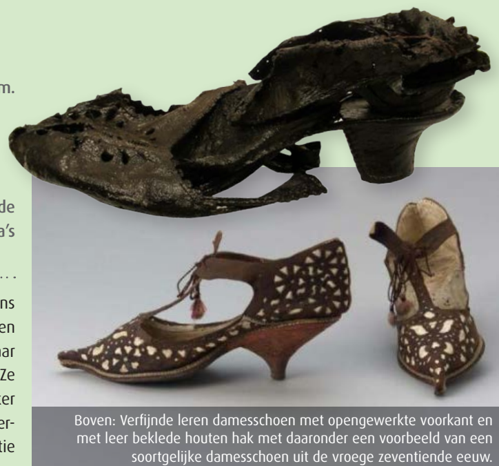
Boven: Verfijnde leren damesschoen met opengewerkte voorkant en met leer beklede houten hak met daaronder een voorbeeld van een soortgelijke damesschoen uit de vroege zeventiende eeuw.