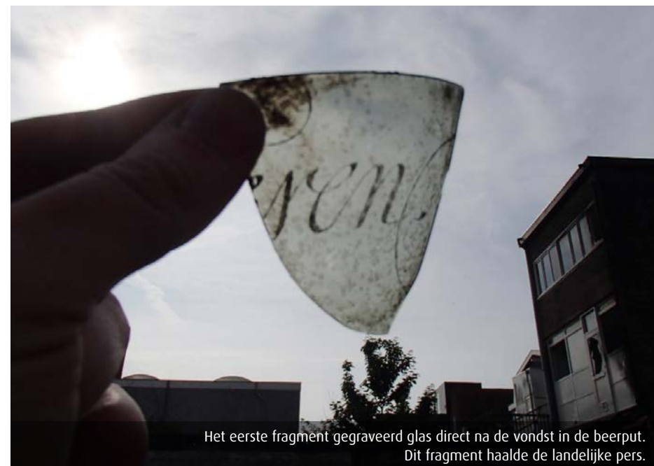
Het eerste fragment gegraveerd glas direct na de vondst in de beerput. Dit fragment haalde de landelijke pers.

Daarover meer in een volgende nieuwsbrief.